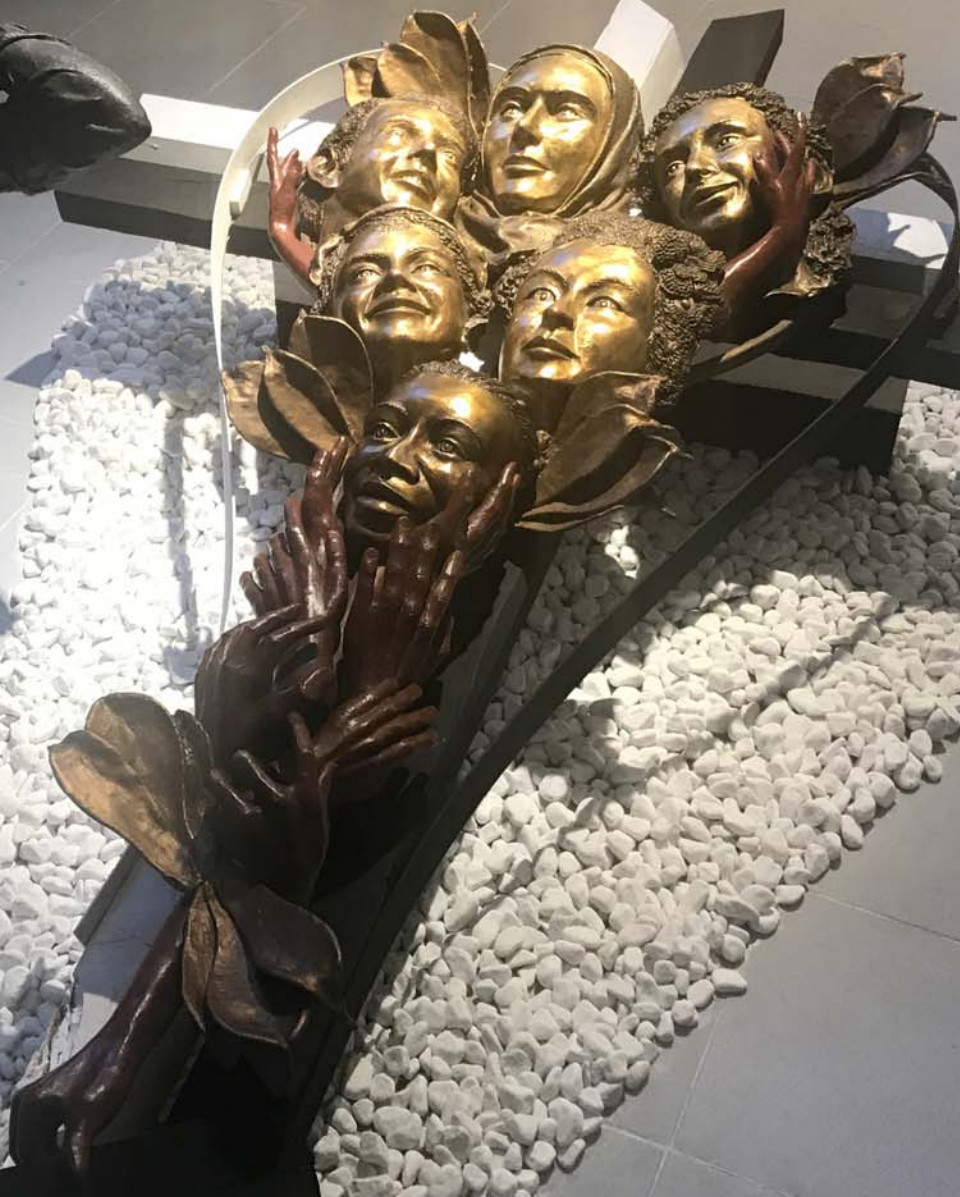
DIALOGO DI FEDE