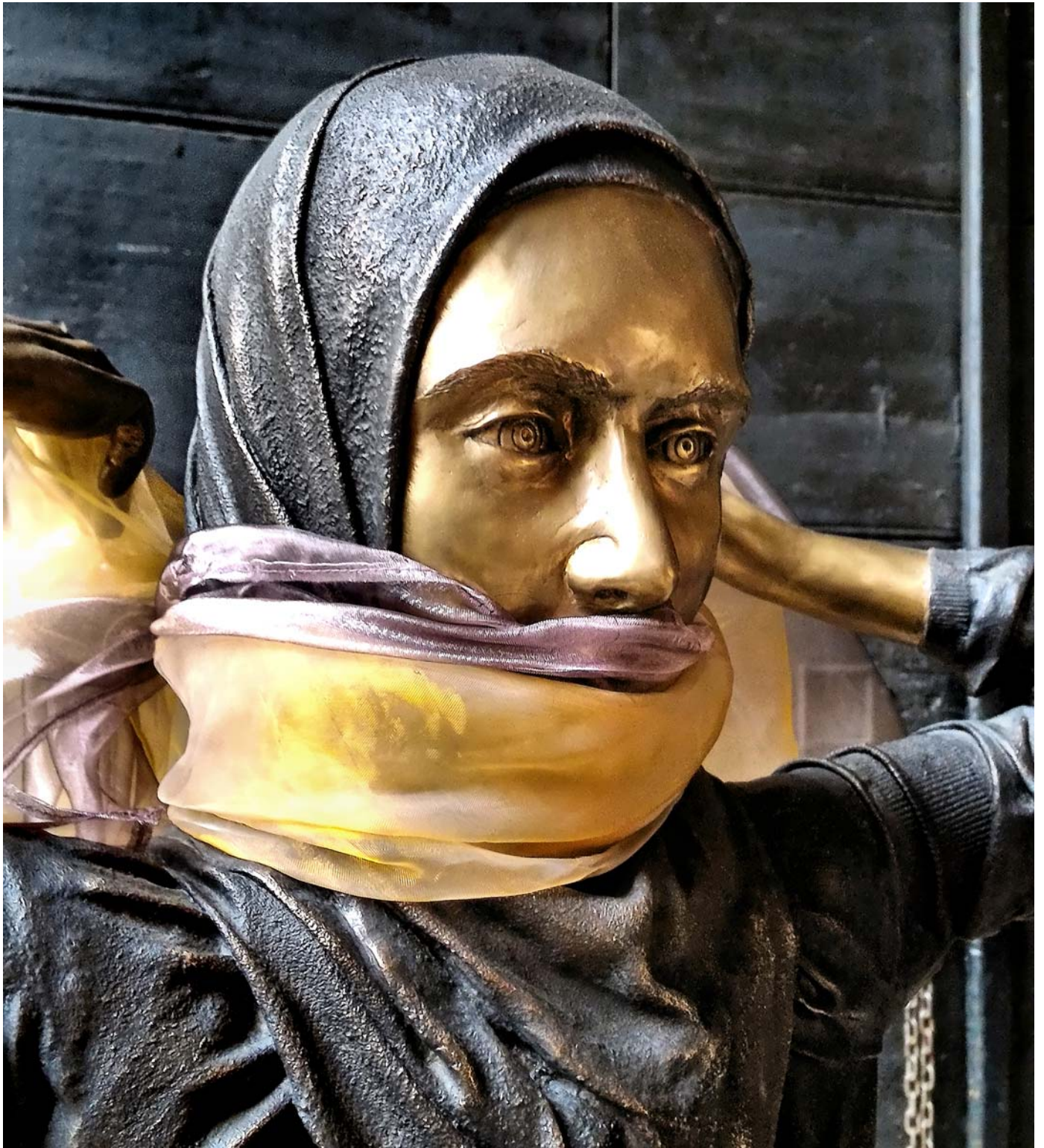
ASMEA - CULTURA ARABA Bronzo, altezza naturale, 2015